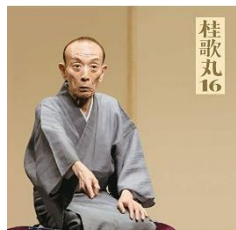
桂歌丸16「朝日名人会」 ライブシリーズ124 CD 2018/6/6